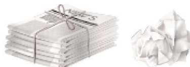
Papiers (journaux, magazines...)