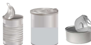
Boîtes et emballages métalliques