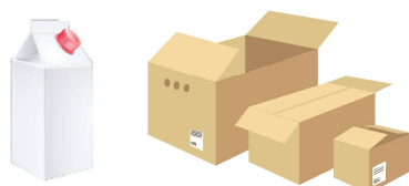
Emballages cartons, briques alimentaires